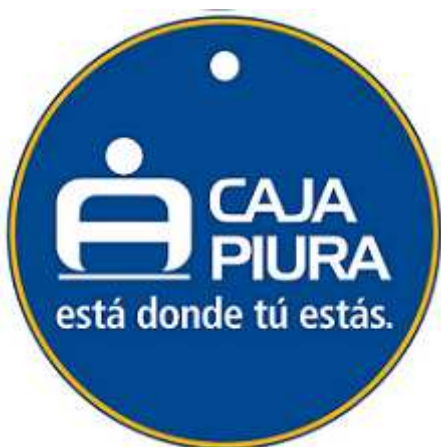
MODELO DE LLAVERO